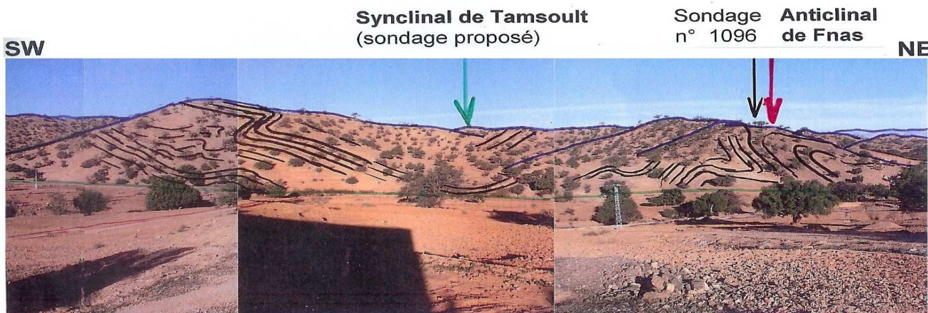
Photo-montage 1 – Synclinal de Tamsoult et Anticlinal de Fnass, dans la série Carbonatée Terminale.